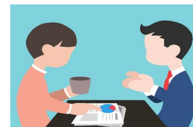
DESIGNATION EVENTUELLE D'UN.E REFERENT.E POUR LE ONBOARDING