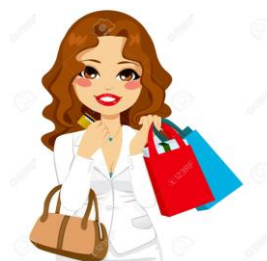
REMISE DU PACK DE BIENVENUE (GOODIES...)