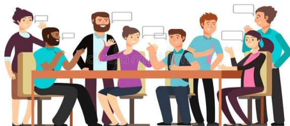
ENJOY L'AVENTURE AMEXIEENNE !