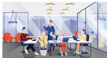
PRESENTATION DES LOCAUX ET DES PANNEAUX D'INFORMATIONS