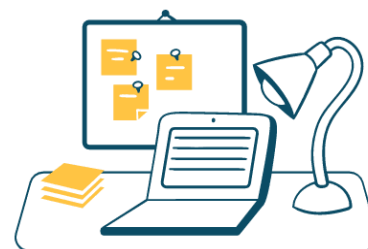
REMISE DU MATERIEL INFORMATIQUE, BADGE...