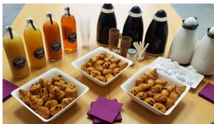
PETIT DEJEUNER D'ACCUEIL / PRESENTATION DES COLLABORATEUR.RICES